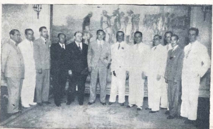
A comissão que promoveu as homenagens ao interventor Rui Carneiro, por ocasião da sua chegada do Rio, tendo ao centro o Chefe do Governo.