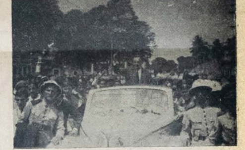
Aspecto da chegada do interventor Rui Carneiro, durante o trajeto do campo da Imbiribeira ao Palácio da Redenção.

"O século XVIII pertenceu à Europa. O século XIX aos Estados Unidos. O século XX pertencerá ao Brasil." Que surpresa nos revelará, em relação ao nosso País, o Recenseamento de 1940. Estamos realmente caminhando para os demais que Teodoro Roosevelt nos profetizou?" Esta é uma questão que o Recenseamento de 1940 nos responderá através do censo de informações que vai elaborar.