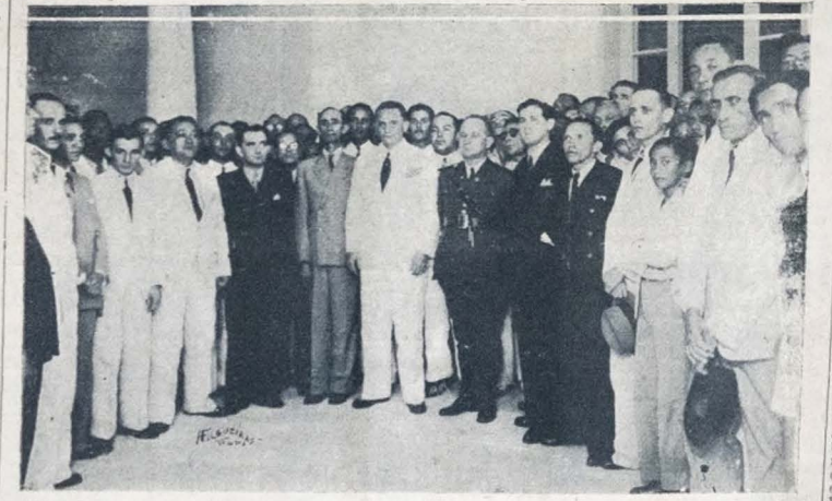
Fotografia feita por ocasião da homenagem prestada ao interventor Ruy Carneiro, pelo pessoal da A UNIÃO e da Imprensa Oficial.

HOMENAGEARAM ONTEM O INTERVENTOR RUY CARNEIRO — Os discursos pronunciados — O agradecimento do Chefe do Governo