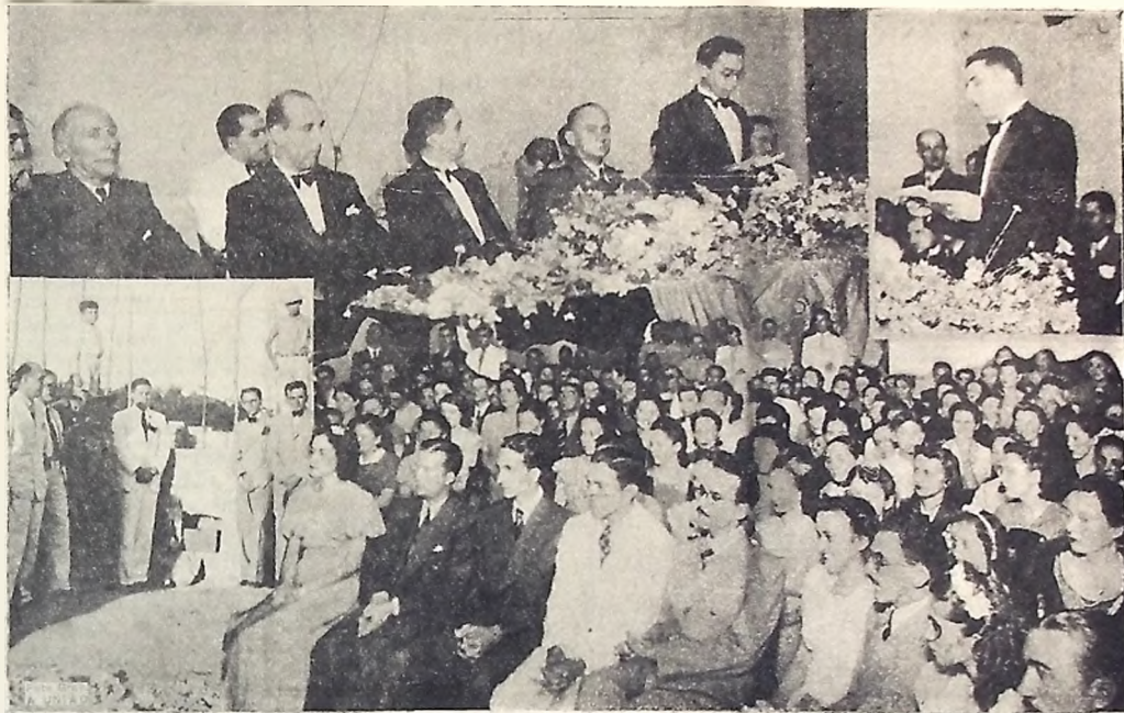
Vários aspectos das brilhantes solenidades.

DECORRERAM COM EXCEPCIONAL BRILHANTISMO AS SOLENIDADES DE ANTE-ONTEM NESSE ESTABELECIMENTO DE ENSINO SUPERIOR