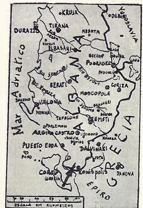
Mapa do território do Reino da Albânia, incorporado à Itália na sexta-feira da Paixão de 1939, e agora teatro da luta entre os exércitos helenicos e fascistas

LONDRES, 5 — (Agência Nacional — Brasil) — Nesta capital, considera-se o novo acordo comercial turco-britânico, como o primeiro passo sério da Inglaterra para desafiar a dominação alemã nos Balcãs.