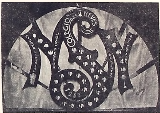
Quadro da turma concluinte do Colégio das Neves

A solenidade, ontem, da entrega de diplomas à primeira turma concluinte do curso ginasial