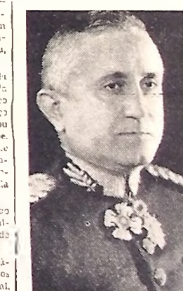
General Gaspar Dutra

A propósito do quarto aniversário da administração do ministro da Guerra, o general Góis Monteiro enviou ao presidente da Associação Bra-