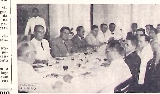
Aspecto do almoço de confraternização dos bachareis de 1930, realizado no Recife.

Os bachareis de 1930, formados pela Faculdade de Direito de Recife comemoram, ante-ontem, solenemente, na bela capital a passagem do 10.º aniversário de sua criação de grau.