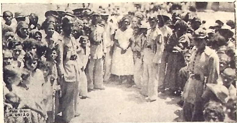
A espera do Natal de carne verde: no Mercado de Tambiã

O sentimento de um tal programa revigorou-se com mais força no atual dirigente da Paraiha, pela convicção de sua aplicabilidade, último processo de salvamento da coisa pública, depois que retornou do Rio de Janeiro, onde, em nome da nossa terra reduzida à penuria, realizou, por meio de um sacrifício pessoal ao que se deve pelo menos um reconhecimento normal, a mais dolorosa peregrinação de Ministério em Ministério, visando tal ou qual medida que nos fôsse benéfica na recuperação econômica que ora nos preocupa.