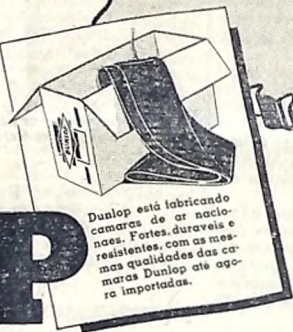
Dunlop está fabricando camaras de ar nacionais. Fortes, duráveis e resistentes, com as mesmas qualidades das camaras Dunlop até agora importadas.