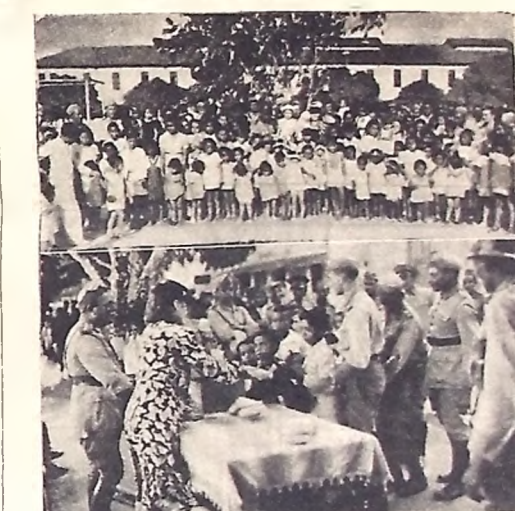
Aspecto do Natal dos pobres no quartel do 22.º Batalhão de Caçadores

A afluência de famílias pobres ali foi numerosa, registandose a melhor ordem na distribuição, de sorte que todas foram atendidas, com igual solicitude.