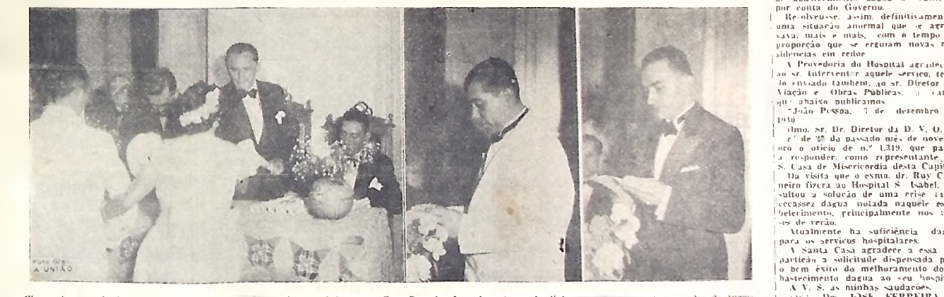
Flagrantes apanhados na Academia de Comércio, vendo-se o interventor Ruy Carneiro fazendo entrega de diplomas quando pronunciavam os seus discursos.

SOLENISSIMA A ENTREGA DOS DIPLOMAS DOS CONTADORES DE 1940, COM A PRESENÇA DO SR. INTERVENTOR FEDERAL E ALTAS AUTORIDADES ESTADUAIS