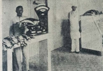
A INSTALACAO ONTEM DA PEIXARIA MODELO DA CAPITAL: 1) — O ato de instalação, vendo-se o interventor Argemiro de Figueiredo ladoado pelo cel. Alberto Pequeno e dr. Bóto de Menezes, e outras altas autoridades; 2) — O Chefe do Governo inspeciona a máquina tipo "Salbroe" para fabricação de gelo; 3) — Balcão de vendas e vitrine para exposição de pescado.

Realizou-se ontem às 9 horas a inauguração do empreendimento da Peixaria Modelo da Cooperativa de Pesca da Paraíba.