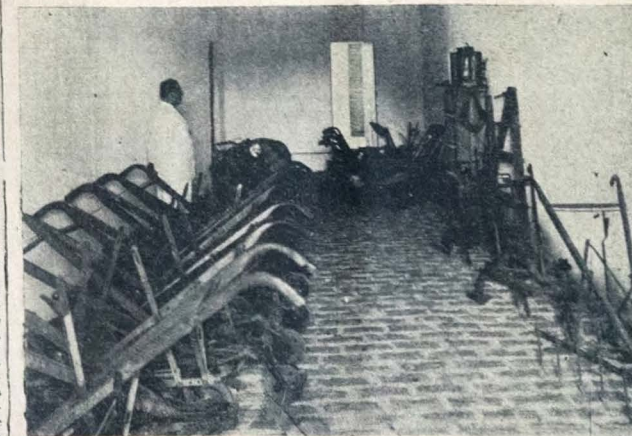
O Govern. do Estado, no intuito de difundir amplamente a lavoura racional, adquire anualmente centenas de máquinas para venda ao agricultor pelo preço de custo e sem pec em conta as despesas de transporte. A fotografia acima, tirada em Serra Branca, Ilheus, do município de S. João do Carri, mostra um dos muitos depósitos de máquinas existentes no interior do Estado.