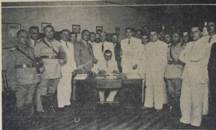
No "cliché" acima vemos o feliz possuidor do Título do Plano UNIVERSAL "H", sob n.º 057.727, DA EMPRESA CONSTRUTORA UNIVERSAL, LTDA.