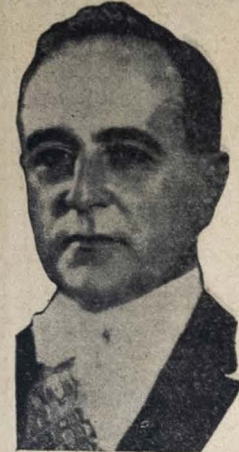
Presidente Getúlio Vargas

O Chefe da Nação aprovou o parecer do Conselho, no sentido de ser enviada uma Missão Comercial aos países da América Latina, especialmente Venezuela, Colombia, Equador e Panamá e ainda á America Central, para observação desses mercados, com o objetivo de desenvolver as nossas exportações de tecidos e produtos manufaturados