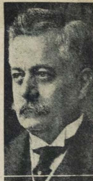
Dr. Epitácio Pessôa