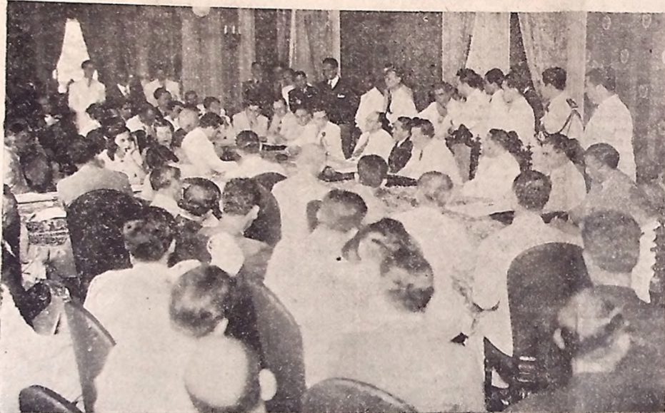
CONFERENCIA REGIONAL DOS INTERVENTORES. EM RECIFE: — Flagrante da sessão do dia 28 do mês recém-findo, quando falava o interventor Argemiro de Figueirêdo.

O interventor Argemiro de Figueirêdo almoçou ante-ontem em companhia do general Firmo Freire — Os interventores excursionaram a Iguarassú e Itamaracá — Presidiu à sessão de ontem o interventor Osman Loureiro — Elementos da colônia paraibana, no Recife, ofereceram ontem um almoço ao chefe do governo paraibano que, após, passeiou a pé pelo centro da cidade, demorando-se, em companhia de vários amigos, no Café Lafaiete — O interventor Agamenon Magalhães oferecerá hoje, no Grande Hotel, uma festa aos seus colegas nordestinos — Integra do discurso pronunciado ante-ontem pelo interventor Argemiro de Figueirêdo, ao abrir os trabalhos da sessão de que foi presidente