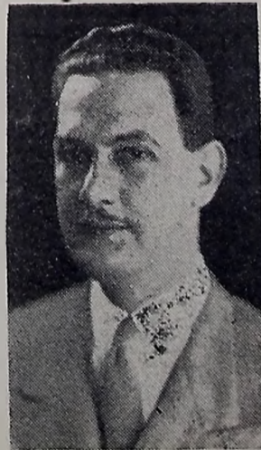
Major Felinto Muller

Por ato de ante-ontem, do sr. Presidente da República, foi promovido ao posto de major, o cap. Felinto