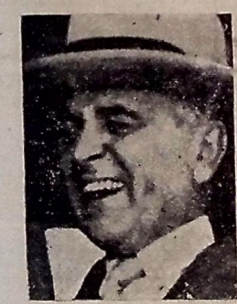
Presidente Getúlio Vargas

S. excia. viajou, de automovel, da Fazenda Santos Reis à cidade de S. Borja, onde recebeu grandes homenagens, partindo de regresso à capital da República, em avião militar — Ao chegar ao aeródromo Santos Dumont, o Chefe do Governo Nacional foi recebido por todo o Ministério, altas autoridades civis e militares e grande massa popular, seguindo, após, para Petrópolis a fim de completar — a temporada de verão —