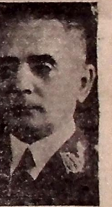
General Firmo Freire

Um telegrama do comandante da 7. R. M. ao interventor Argemiro de Figueiredo