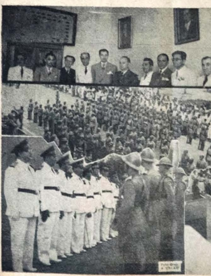
Parada militar e concentração escolar, em frente ao Palácio da Redenção. Na sacada o sr. Interventor Federal, auxiliares da administração e vários amigos.