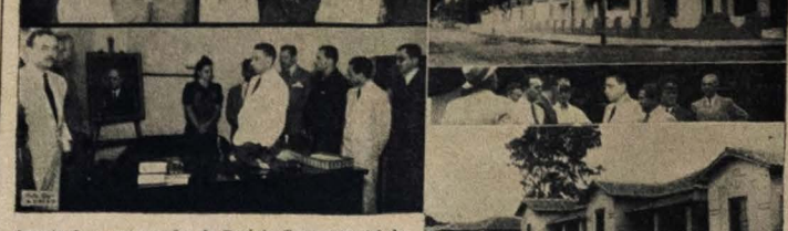
Aspecto das comemorações do Decênio Governamental do Presidente Getúlio Vargas. Grupo em porta da Catedral Metropolitana, após a missa de ação de graças na Delegacia do Ministério do Trabalho e na "Vila Dez de Novembro".