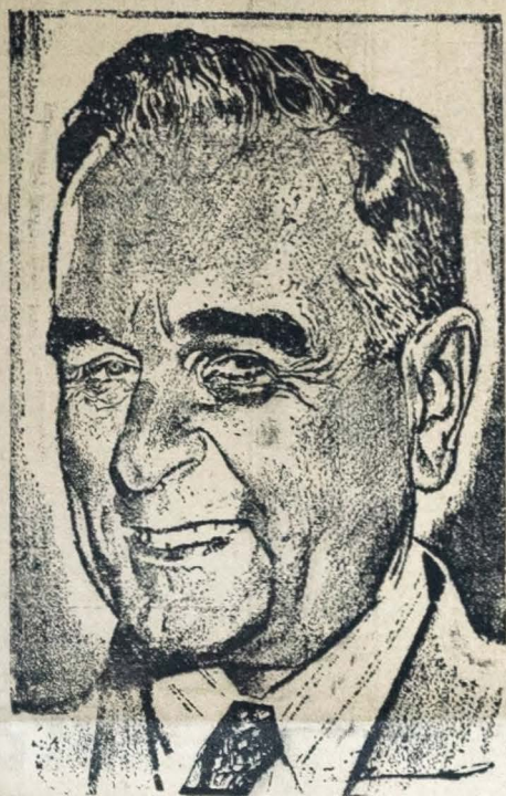
PRESIDENTE GETÚLIO VARGAS

RIO, 29 (Agência Nacional — Brasil) — Viajando no avião "Luckead 04", do exército regressou de S. Borja, no Rio