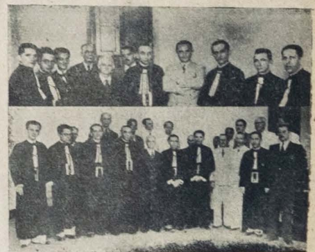
Em cima: a visita do interventor Ruy Carneiro ao Tribunal de Apelação. Em baixo: aspecto por ocasião das despedidas do des. Paulo Hipacio.

A visita feita ontem a essa alta Corte Judiciária pelo interventor Ruy Carneiro — A homenagem prestada no plenário ao desembargador Paulo Hipacio