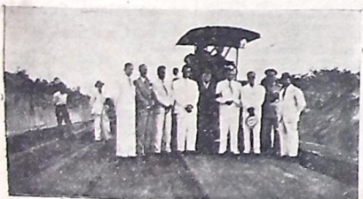
Na estrada de Cabedêlo

FOI no passado um dos governos mais laboriosos que a Paraíba teve o general Camilo da Holanda. Assumindo a mais alta investidura do Estado quando bem precárias eram as finanças, debatendo-se a Europa numa guerra então sem precedentes e cujos efeitos se faziam sentir no mundo inteiro, nem por isso deixou o general Camilo de Holanda de levar a efeito um plano administrativo de que muito se beneficiou a Paraíba. Mais de vinte anos são decorridos depois que s. s. deixou a direção dos destinos do Estado. Muitas transformações sofreu a capital desde então. Ruas novas e largas foram abertas, edifícios públicos e particulares de grande envergadura se ergueram em todo o perímetro urbano, obras de assistência foram