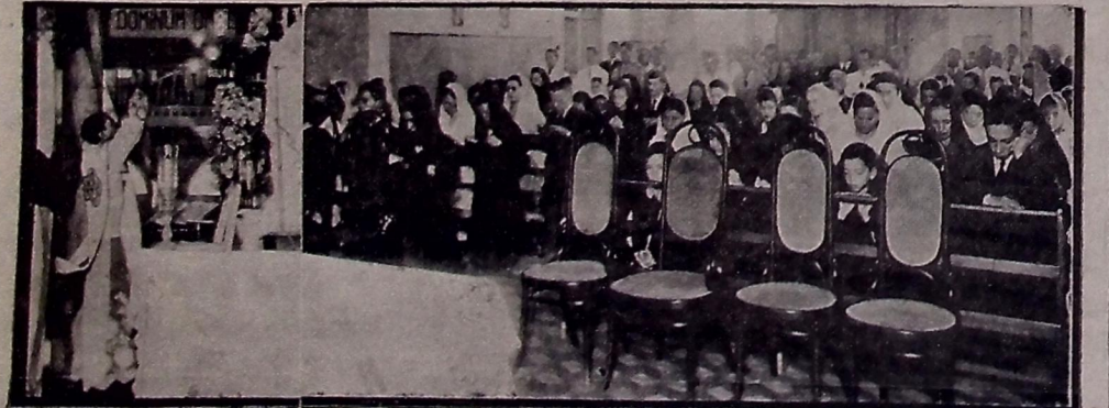
Aspecto apanhado durante a cerimônia religiosa