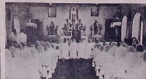
Um aspecto da missa

porém, baldados todos os esforços da ciência. Os funerais do sr. Borja Peregrino serão feitos a expensas do Governo do seu Estado — última homenagem da coletividade paraibana ao homem publico que tanto a serviu. O fêretro sairá às 16 horas, da Casa (Conclui na 3.ª pag.)