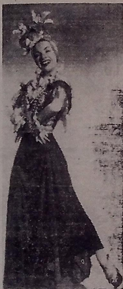
O que é que a baiana tem ?

Hoje! — Matinée às 4 horas e soirée às 7 1/2