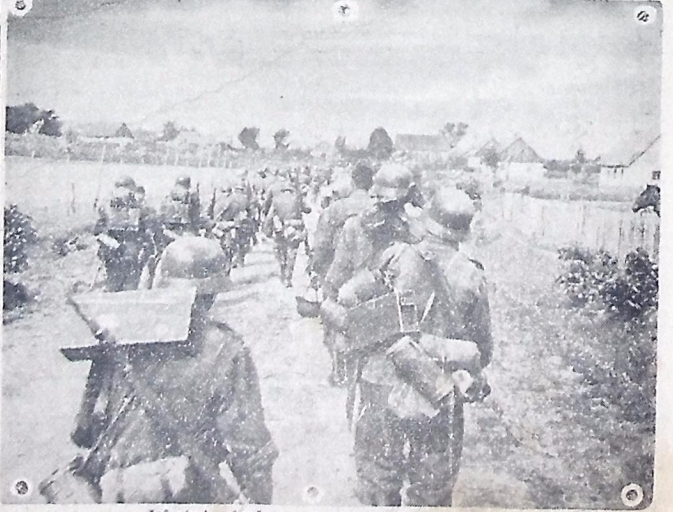
Infanteria alemã em marcha, no território inimigo.

HOLLYWOOD, 2 (U. P.) — Os cadetes da Escola de Aviação depois de examinarem 500 fotografias de "girls" das mais famosas e situações que participaram de um concurso, foram de parecer, por esmagadora maioria de votos, que Vera Zornina ballarina e atriz de cinema tem "a melhor fuselagem do mundo".