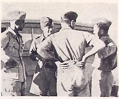
Funcionários do Serviço de Informações da RAF interrogam um piloto alemão.

NEW YORK, 3 (T. O.) — Sob o título "Os ataques aéreos alemães contra a Inglaterra, aumentam", o "New York Times" publica hoje uma notícia de Londres segundo a qual cinco cidades inglesas, sofreram enormemente durante a noite passada em consequência dos bombardeios alemães. Os alemães fôram favorecidos por um magnífico luar, voaram relativamente baixo e lançaram suas bombas pesadas em vôo plicado. Observa-se que estes ataques fôram realizados somente poucos dias após a declaração de Churchill que afirmou estarem os alemães sentindo escassez de aviões.