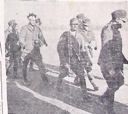
Prisioneiros alemães no Deserto Ocidental

"ENGANAMO-NOS APENAS NUM PONTO: NÃO ESTAVAMOS A PAR DOS GIGANTES COS PREPARATIVOS REALIZADOS PELA RUSSIA, NEM ACERCA DO PERIGO QUE AMEAÇAVA, NÃO SÓ O REICH, COMO A EUROPA". (DO DISCURSO DE HITLER)