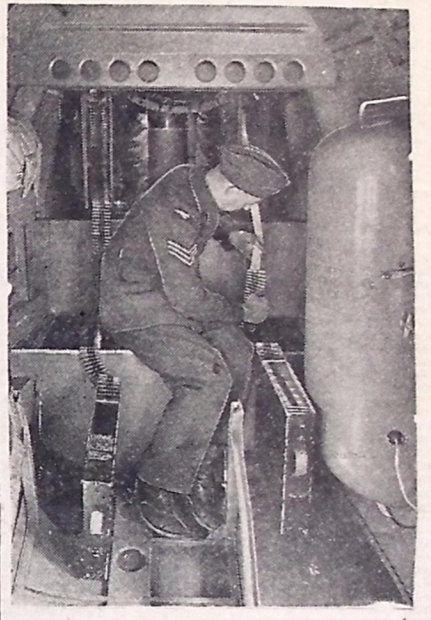
Interior de um avião fornecido à Inglaterra pelos Estados Unidos.

Médicos, enfermeiras e ajudantes estão a postos nos hospitais, prontos para receberem os feridos. Aquelles que estiverem em condições, serão levados diretamente para casa, mas não haverá manifestações de recepção em virtude da brevidade da tregua.