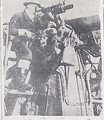
Um soldado britânico faz observações