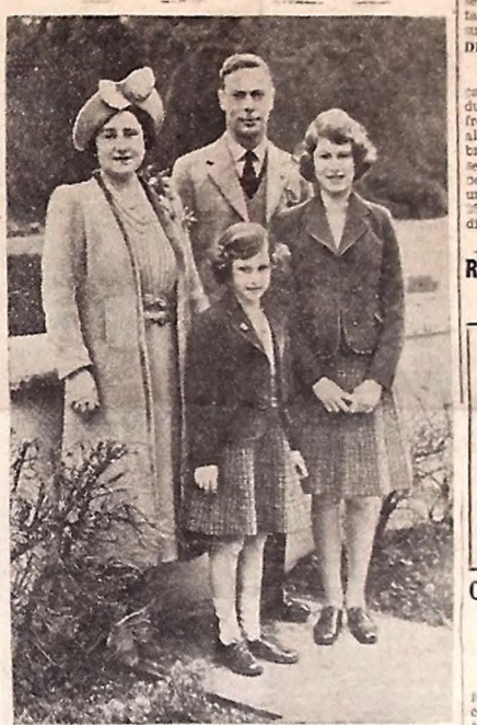
A FAMILIA REAL BRITANICA NO LAR — A fotografia mostra o rei Jorge VI e a rainha Elisabeth, nos jardins do Castelo de Windsor, em companhia das princesas Elisabeth e Margaret Rose

DESTRUIDAS NUMEROSAS UNIDADES ALEMãs MOSCOU, 7 (U. P.) — As forças russas, numa batalha que durou cinco dias destruíram na frente da Ucrânia duas divisões alemãs, um regimento e uma brigada anti-tanks. Calcula-se que os germanicos tiveram pelo menos 5.500 mortos. As unidades destruídas foram a 35.ª divisão mecanizada, a 59.ª divisão de tanks, o 43.º Regimento (Conclui na 2.ª pag.)