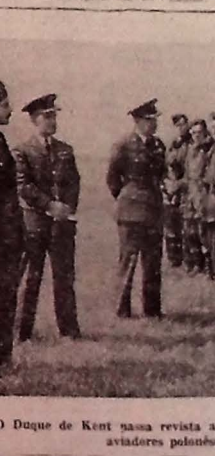
O Duque de Kent passa revista a um contingente de aviadores poloneses.