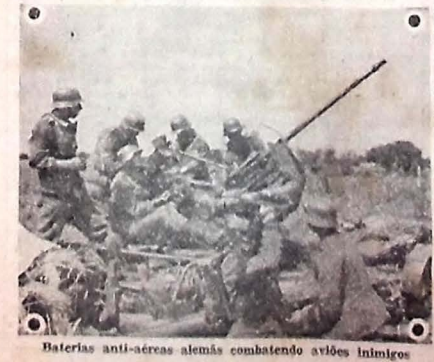
Baterias anti-aéreas alemãs combatendo aviões inimigos

MOSCOU, 7 (U. P.) — Informa-se que os alemães implantaram um regime de opressão na Letônia, na Estônia e na Lituânia. A propósito expressa-se que estão sendo realizadas prisões em massa e todos os homens entre 15 e 34 anos são obrigados a se inscrever em organizações de trabalho alemãs a fim de serem destinados a diversas tarefas.