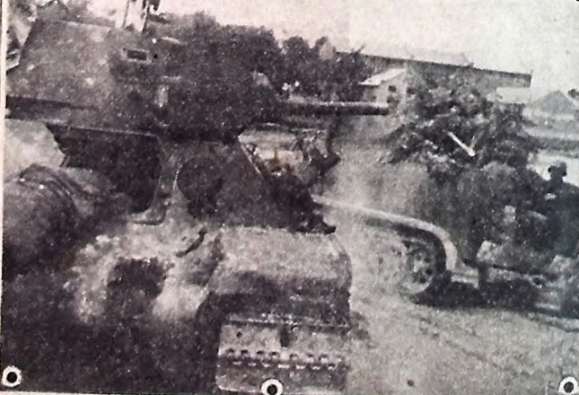
Tropas alemãs passando por "tanks" inimigos destruídos

RIGOROSO RACIONAMENTO DO PAO NA ITALIA ROMA, 7 (U. P.) — Por 14-vingti — "Venha ceiar comigo" (Conclue na 3.ª pag.)