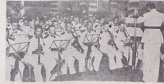
Banda da Força Policial do Estado, no programa especial da "Rádio Tabajara", em comemoração ao aniversário do "Discurso do Rio Amazonas"

LISBOA, 10 (U. P.) — O navio "Lima" levou para os Açores novo contingente de tropas para retorgar a guarnição local.