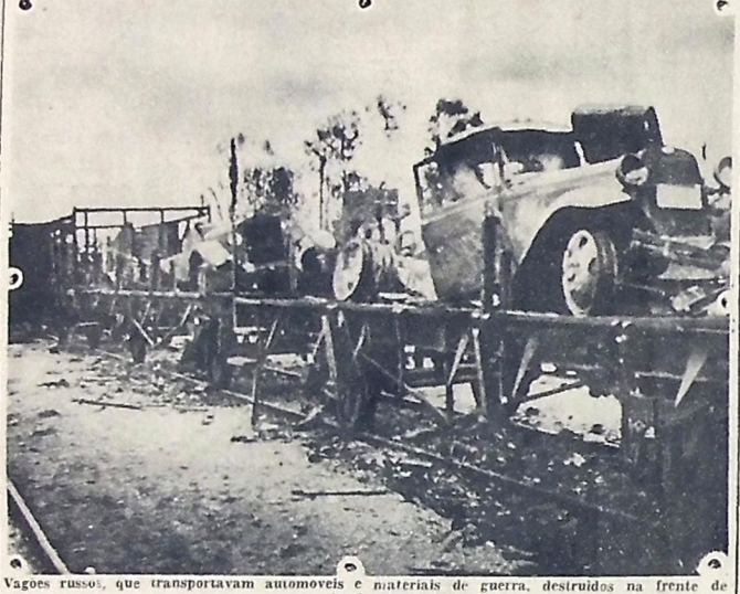
Vagões russos, que transportavam automóveis e materiais de guerra, destruídos na frente de Smolensk.