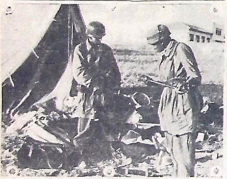
Paraquedistas alemães em ação no terreno adverso