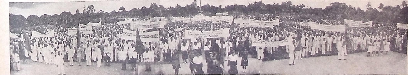
Fragante da grande concentração trabalhista na Praça da Independência