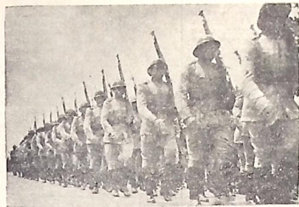
Aspecto do desfile das tropas em continência ao Interventor Federal e autoridades