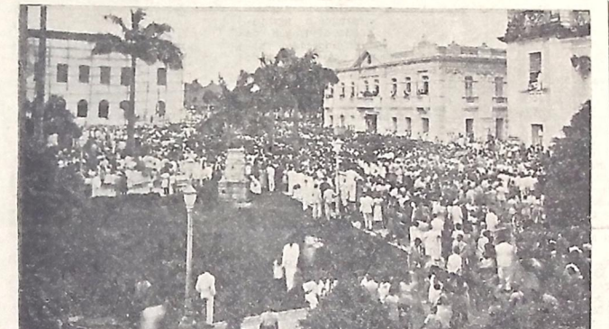
A concentração em frente ao Palácio do Governo