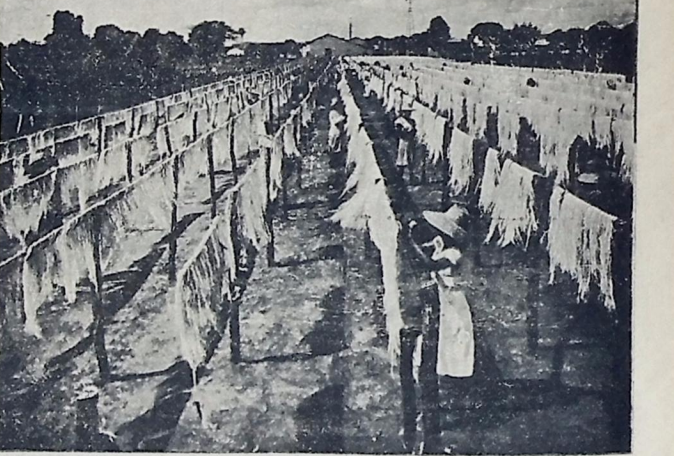
estendidas ao sol, pouco a pouco as fibras secam, tornam-se alvas e sedosas e ficam prontas para o enfileiramento

rendimento é um fato concreto. A iniciativa particular já se manifestou, com seus ensaios na fundação dos primeiros campos de forrageiras em colaboração com os técnicos do governo. E não ficou somente nestes primeiros ensaios, pois posso adiantar que muitos ampliaram seus plantios, assim demonstrando uma mais forte confiança e compreensão dos trabalhos. Estes fazendeiros estão concorrendo para a difusão do emprego desses métodos, ao mesmo tempo que cuidam da prosperidade de suas fazendas. Agora que se trata com carinho de tão palpitante assunto, apenas quero exemplificar que, no Estado