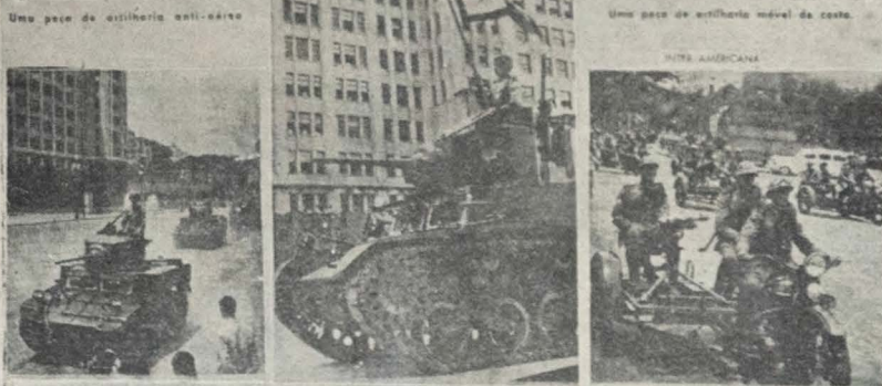
Estabelecimento de com. de combate leve, em... Um core de combate construído e... Companhia de mestrizantes do Polício Militar...