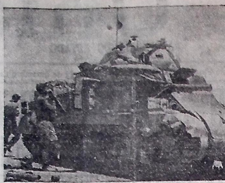
Pesado "tank" norte-americano em ação na Tunísia.

qualquer ação de grande envergadura. CONTINUA O VANCO RUSSO MOSCOU, 11 (U. P.) — As baterias da artilharia russa destruíram um regimento de infantaria alemão no setor noroeste de Stalingrado e abriram passagem para o avanço da infantaria, avanço que levou o inimigo de vencida, apesar da energética resistência, o que permitiu a reconquista de várias posições estratégicas. Simultaneamente poderosas escuadrilhas de bombardeiros de mergulho empreenderam intensos ataques às colunas de abastecimentos e concentrações de tropas alemãs a oeste de Ráhev. No setor, também a oeste de Ráhev, os russos derrotaram um batalhão nazista de infantaria. Os alemães tiveram 450 mortos e perderam abundante material. A sudoeste de Stalingrado chegaram novos reforços para o inimigo, mas as tropas soviéticas continuaram a obter consideráveis vantagens.