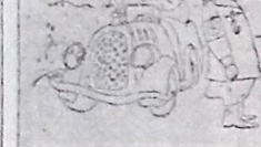
O ALTO CUSTO DA VIDA — O guarda do Caucaso: "A gasolina anda muito cara por aqui — uns 2.000 nazis por litro" (Do "American Mercury")

Nossos técnicos nos afirmam que os aviões russos são moderníssimos e extremamente eficientes. Seus pilotos são bem treinados e utilizam habilmente os aviões que a Grã Bretanha e os Estados Unidos tem enviado. Os pilotos russos tem