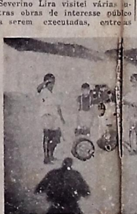
Barris e "galões" que acondicionados por menores, são empregados para o abastecimento da água de Brejo do Cruz.