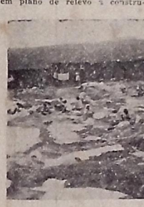
Laradeiras em atividade no vertedouro do aqüeduto em Cajazeiras.

De uma maneira geral, é preciso criar um ambiente saudável, onde os visitantes possam se