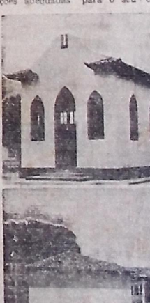
Asilo de Mendicidade "Carneiro da Cunha", remissão de 11 a capela e 21 em do pavilhões para os asilados, construído na administração do interventor Ruy Carneiro.

Assistência social e auxílio desestruturado, o Asilo de Mendicidade "Carneiro da Cunha" inclui obras do maior relevo da administração do interventor Ruy Carneiro.