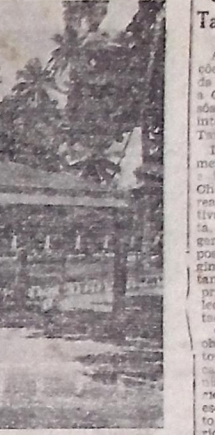
Casas de colonos na Fazenda S. Rafael