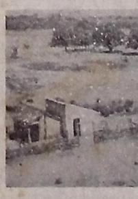
Aspecto das fontes termas de Brejo das Freiras, mostrando dois dos banheiros existentes e a casa do administrador.

O diretor da Repartição de Saneamento fez-nos um relato histórico das condições ali levadas a efeito, assistido na excelência das propriedades terapêuticas das águas minerais radio-ativas de Brejo das Freiras, que, nesse sentido, podem ser comparadas às melhores do país. Diversos especialistas da Divisão de Fomento do Departamento Mineral, do Ministério da Agricultura, realizaram numerosas perfurações no local, tendo no momento um vazão de cerca de 100 metros cúbicos.