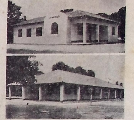
No Asilo de Mendicância, a sede da administração e o refeitório que hoje serão inaugurados.

instalações par... empreendimento campo de voleibol, pista de corridas, barras, etc. A sociologia e preparo físico à educação moral e intelectual, as professoras da Colô-