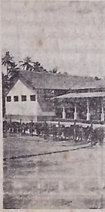
Aspecto do edifício da Colônia de Férias, apanhado do jardim de recreio.

O diretor da D. V. O. P. terá ao mesmo tempo para a acomodação dos veículos.