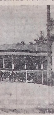
Asilo de Mendicidade "Carneiro da Cunha", remissão de 11 a capela e 21 em do pavilhões para os asilados, construído na administração do interventor Ruy Carneiro.

Assistência social e auxílio desestruturado, o Asilo de Mendicidade "Carneiro da Cunha" inclui obras do maior relevo da administração do interventor Ruy Carneiro.