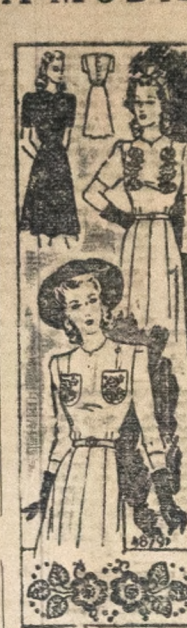
Borlados de vários estilos. — Penquismos, diferença entre os dois modelos, pois que seus detalhes são exatamente os mesmos. Divergem nos motivos escolhidos para ornamento, que em um são flores em círculo e em outro são bolsos bordados. De preferência, os ornamentos sejam no lado da cor, visto como, por exemplo, o vermelho