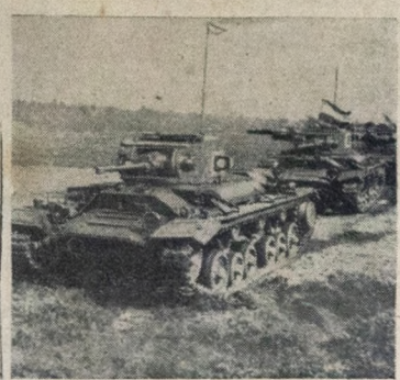
Poderosos "tanks" britânicos chamados "Valentine Mark III" em manobras.

1 MILHAO DE HOMENS RANGOON, 3 (U. P.) — O comunicado de hoje dá conta do primeiro choque havido no territorio de Burma, entre as tropas aliadas e japonesas. Esse encontro verificou-se no norte da Fonia da Victoria, no extremo sul de Burma. O comunicado diz: "Um pequeno destacamento japonês conseguiu infiltrar-se em Fokpyi, distrito de Melgu. Depois de localizado pelas nossas tropas, uma das nossas colunas desfilhou um ataque contra os japoneses que bateram em retirada antes de entrar em contacto serio com as nossas forças, deixando atraz de si varios mortos".