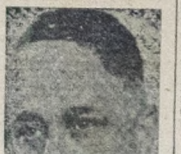
Ministro Marcondes Filho

RIO, 3. — (A. N.) — No Ministério da Justiça com uma assistência impressionante verificou-se às 10 horas, a posse