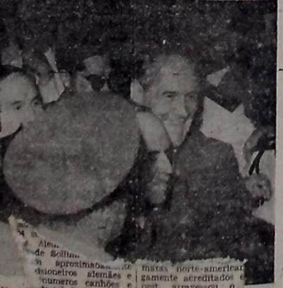
A chegada do chanceler Sotfy M... (Conclui na 6.ª pag.)

Hugo Cavalero ROMA, 19 (U. P.) — Via Zurich — Comunica-se que o general Vitério Ambrosia foi designado Chefe do Estado-Maior das Forças Armadas Italianas em substituição ao general Hugo Cavalero. Também o general Mario Roatta, atualmente chefe do Estado-Maior do Exército assumiu o comando do segundo exercito italiano. Ambas essas designações em troca de "visar amizade" 1.200 ATAQUES CONTRA MALTA LONDRES, 19 (R.) — Com os alarmes aéreos de ontem montam a um total de 1.200 ataques aéreos contra a ilha de Malta desde que a Itália entrou em guerra. (Conclui na 2.ª pag.)