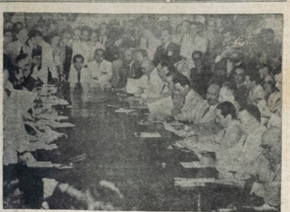
Um detalhe da mesa de Conferencia, durante a reunião dos chanceleres americanos para o rompimento das relações entre os países americanos e o "eixo".

De regresso, o Presidente Vargas despatchou com o titular interino da Justica e com o Ministro da Educação.