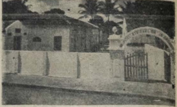
Ambulatório e Enfermarias