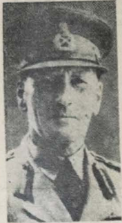
O general Auchinleck, comandante das forças aliadas no Egito

Em suas novas posições, as forças imperiais e do Império dispõem de um numero consideravel de "tanks" e veículos motorizados. Como de costume, estes ultimos vão acompanhando as fortes unidades de artilharia anti-aérea, um pelotão que os impulsiona sobre as formações blindadas em Fil-Ablanca e Quattara, sob o comando de Alexandri-Cairo. Uma coluna durante a noite, se aproximou das linhas italianas com uma mil bandada. (continua na 2ª pag.)