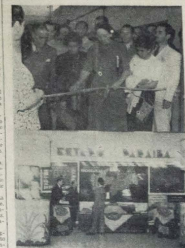
INAUGURACAO DA 2.ª EXPOSIÇÃO NACIONAL DE EDUCAÇÃO, ESTATÍSTICA E CARTOGRAFIA. O stand da Paraíba.

GOIANIA, julho (Aéreo) — Faltava está situado no fundo do salão destinado aos Estados sordestinos, ocupando a posição de maior destaque. Devemos destacar a realização deste "stand", as colunas lumb.