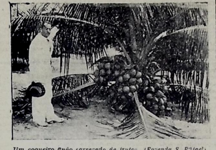
Um coqueiro antigo carregado de frutos. (Fazenda S. Rafael).

bo facilmente às pragas. Apresenta por isso um aspecto sanitário perfeito. No que se refere ao coqueiro comum, conta a Fazenda Mangabeira com uma seção de cultura de milho, já tendo fornecido cerca de 20 mil mudas a particulares. A indústria do coco oferece as mais vantajosas possibilidades, sendo que a sua procura aumentou cada dia. Basta considerar que em nosso meio existem os coqueiros se encontram nos milhares, compra-se um fruto por $500. Com a industrialização, que se processará em breve, gra-