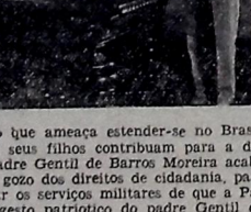
EM FACE da conflagração que ameaça estender-se no Brasil exigindo que todos os seus filhos contribua para a defesa da sua integridade...