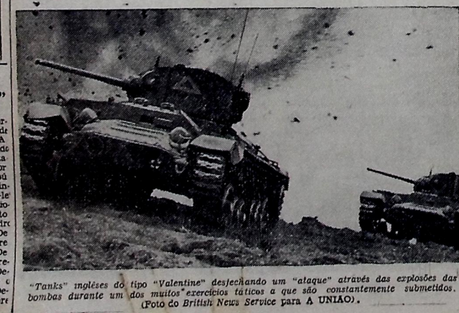
"Tanks" ingleses do tipo "Valentine" desfechando um "ataque" através das explosões das bombas durante um dos muitos exercícios tácticos que são constantemente submetidos.

Quando tempo que se discute a segunda frente? E' o fim do equívoco quânta-colunista. E quem tem agora esta força de decisão merece, de novo, a nossa confiança. Esta mesma decisão há de romper de vez com todos os equívocos e o que nós queremos, para honra do pensamento livre da América, e para que cheguemos a ver, um dia, a libertação dos nossos povos, na Europa, desfigurados no rosto do mundo, pelo odioso deformação mental da ditadura fascista.