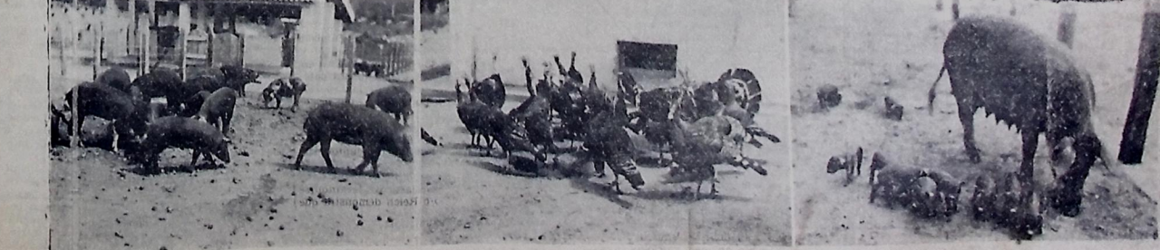
FAZENDA SÃO RAFAEL. 1—Criação de porcos de raça. 2 — Perus bronzeados "Mamutes", 3 — Porquinhos recém-nascidos de raça "Duroc-Jersey".

riedade paraibana de abacate, cujo fruto pesa mais de 2 quilos. O coqueiro anojo, de recente aquisição, constitui uma palmeira de valor econômico inapreciável, bastando considerar que, cada pé dá, no mínimo, um rendimento de 150 frutos por ano. Importado do Ceará, já contamos com 600 pés de coqueiro-anojo cuja preciosidade é incontestável, frutificando em 2 anos e meio, além de proporcionar a vantagem de se dar ca-