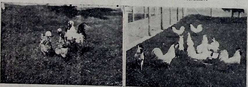
1 — Galinhas adquiridas no Cartão, de grande porte e excelente qualidade. 2 — Grupo de frangos "Lenoriths"