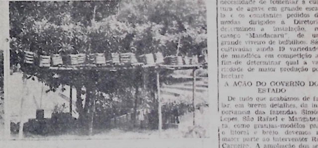
Campo de eucaliptos em pleno desenvolvimento. — Mudas e enxertos de plantas da fazenda "Simões Lopes"

cas à fábrica que está em construção, mais se dilatam as vantagens para o plantio e multiplicação dos nossos coqueiros. DE MANDACARU Funciona junto ao Horto Simões Lopes, um pequeno campo de multiplicação onde são selecionadas sementes de mandacaru, fumo e amendoador, além de um grande viveiro de bulbos de agave e uma empotecação de variedades de mandioca. As sementes de mandioca produzidas já apresentam um grau de pureza satisfatório. O cultivo de boas variedades de fumo para distribuição de sementes era medida inadiável e que merece seja ampliada. A necessidade de fomentar a cultura de agave em grande escala e os constantes pedidos de mudas dirigidos à Diretoria determinou a instalação, no campo "Mandacaru" de um grande viveiro de bulbos. São cultivadas ainda 19 variedades de mandioca em competição a-lim-de determinar qual a variedade de maior produção por hectare.