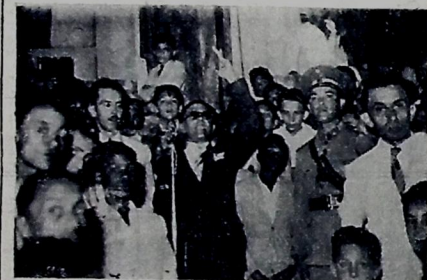
No comício de ontem, quanto falava um dos oradores.

Concentrados inicialmente no Parque Solon de Luena, os operários, depois de falarem vários oradores, desfilaram em seguida pela avenida Duque de Saxe em direção à praça de Caxias, reunindo-se por fim na Praça João Pessoa. A passeata chegou a