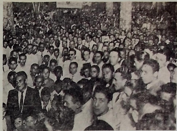
Aspecto parcial da multidão no comício operário de ontem contra o eixo

RIO, 14 (A. M.) — Os jornais registraram, destacadamente, o aniversário do interventor Amaral Peixoto que transcrito hoje. Um diário assinala a coincidência da data do nascimento do interventor Amaral Peixoto com a comemoração da queda da Bastilha. Outro jornal escreve: