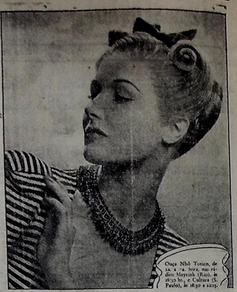
Órgão Não Tônico, de 12 x 14 cm. Para os Rádios Mayrakh (Rio), em 1930, e Cultura (S. Paulo), em 1932 e 1933.

HÁ MULHERES QUE VIVEM uma Eterna Primavera É que elas têm a cutis perfeita, graças ao uso constante do Sabonete Gessy, feito de óleos preciosos da flora brasileira. De espuma abundante e macia, deliciosamente perfumado com um fino "louquet" de essências naturais, Gessy desobstrui os poros e remove a maquiagem e os resíduos cutâneos, sem afetar as funções vitais da pele. Gessy é econômico — produz muita espuma.