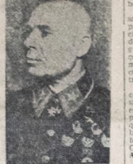
Tinoshenko quebrar as defesas alemãs, enquanto o grosso de suas forças se encontra concentrado em redor da importante cidade industrial, a fim de iniciar as operações de ataque.

PARAQUEDISTAS SOVIÉTICOS NA RETAGUARDA ALEMÃ