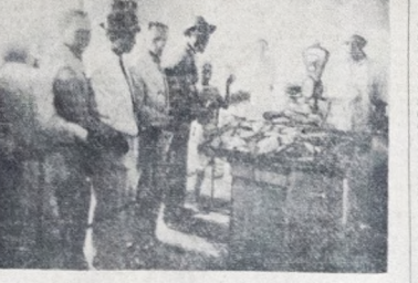
Momento do posto de venda da Cooperativa de Pesca

A COOPERATIVA ATINGINDO A SUA FINALIDADE — Agora, isso já não acontece