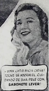
UMA CUTEIRA MACIA CANTAR! PORQUE SE ADORAVEL CUIDANDO DE SUA PELE COM SABONETE LEVER!