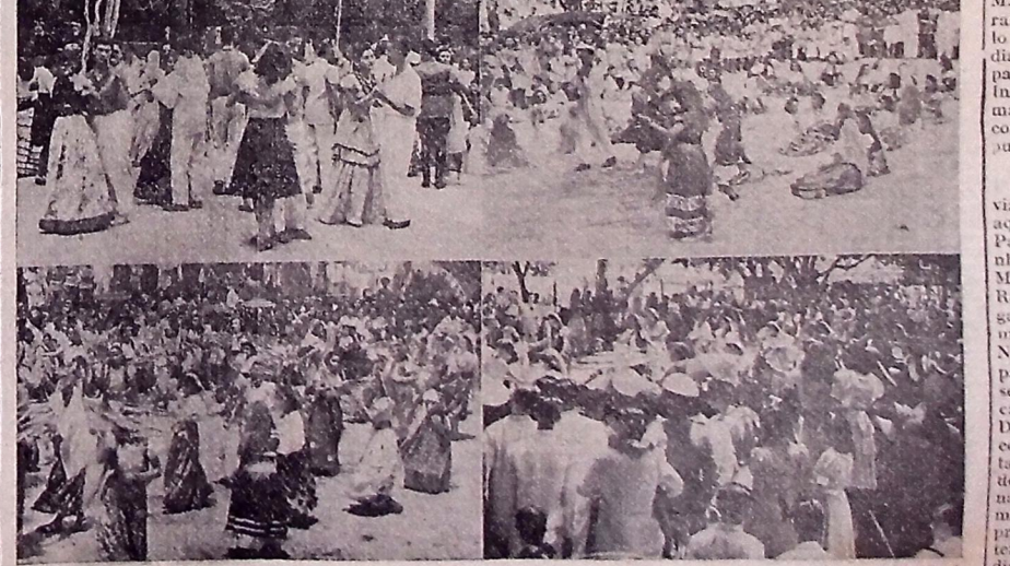
Os flagrantes acima indicam o que foi a festa do Parque Arruda Camara, em benefício da Legião Brasileira de Assistência.