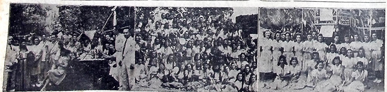
A FESTA DO PARQUE ARRUDA CAMARA — A hora apetitosa do churrasco — Ciganas em repouso — As "policiais", Vê-se por estes flagrantes como foi animada a festa campestre de domingo ultimo. (Texto na 3.ª pag.)