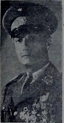
Gal. José Pessoa

O ilustre soldado ainda permanece no Recife PERMANECE NO RECIFE Dando desenvolvimento à sua missão nesta região do país, o ilustre paraibano general José Pessoa, inspetor da Arma de Cavalaria e uma das figuras de maior expressão do Exército. Na capital pernambucana o distinguido soldado foi alvo de significativas homenagens, além das honras devidas que lhe foram prestadas por tropas modernizadas e esquadra de fuzileiros da 7.ª Região Militar. O general José Pessoa faz-se acompanhar pelos capitães Antonio Lira e Wag-