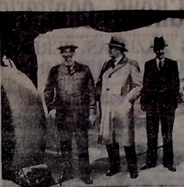
O Primeiro Ministro britânico acaba de visitar uma estação de aviação de bombardeio no sudoeste da Grã-Bretanha...