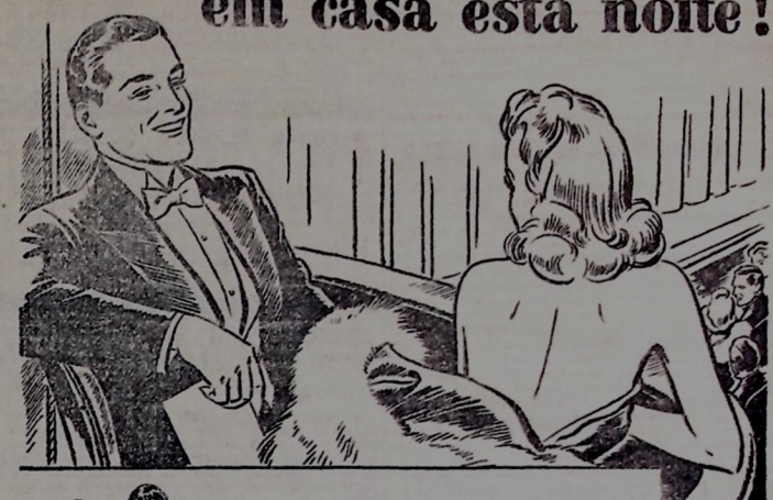
Hoje, a estas horas, não julgava poder vir hoje ao teatro. O delúrio e a obstrução das vias nasais indicavam o princípio de um resfriado.

Antes de deitar-me, pinguei nas narinas algumas gotas do Mistol. O alívio foi surpreendente. Sentí o descongestionamento das vias nasais e pude respirar livremente enquanto dormia.