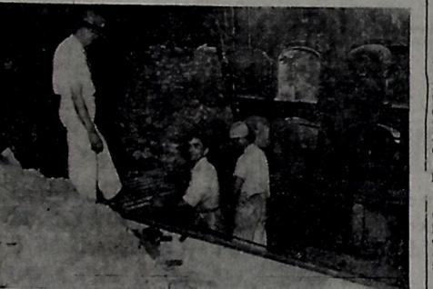
Reforma do cinzeiro da caldeira numero 3 para maior eficiência do serviço.