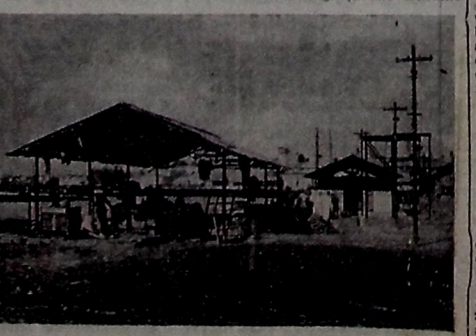
2 — Galpões construídos ainda com o emprego de tubos plenamente aproveitáveis, mas que foram considerados "ferro-velho" e atraídos fora.