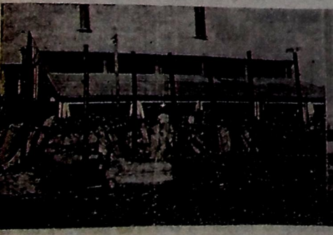
1 — Lenha para as caldeiras espalhada por todos os cantos com tubos servindo de amparo. 2 — Galpões construídos ainda com o emprego de tubos plenamente aproveitáveis, mas que foram considerados "ferro-velho" e atraídos fora.