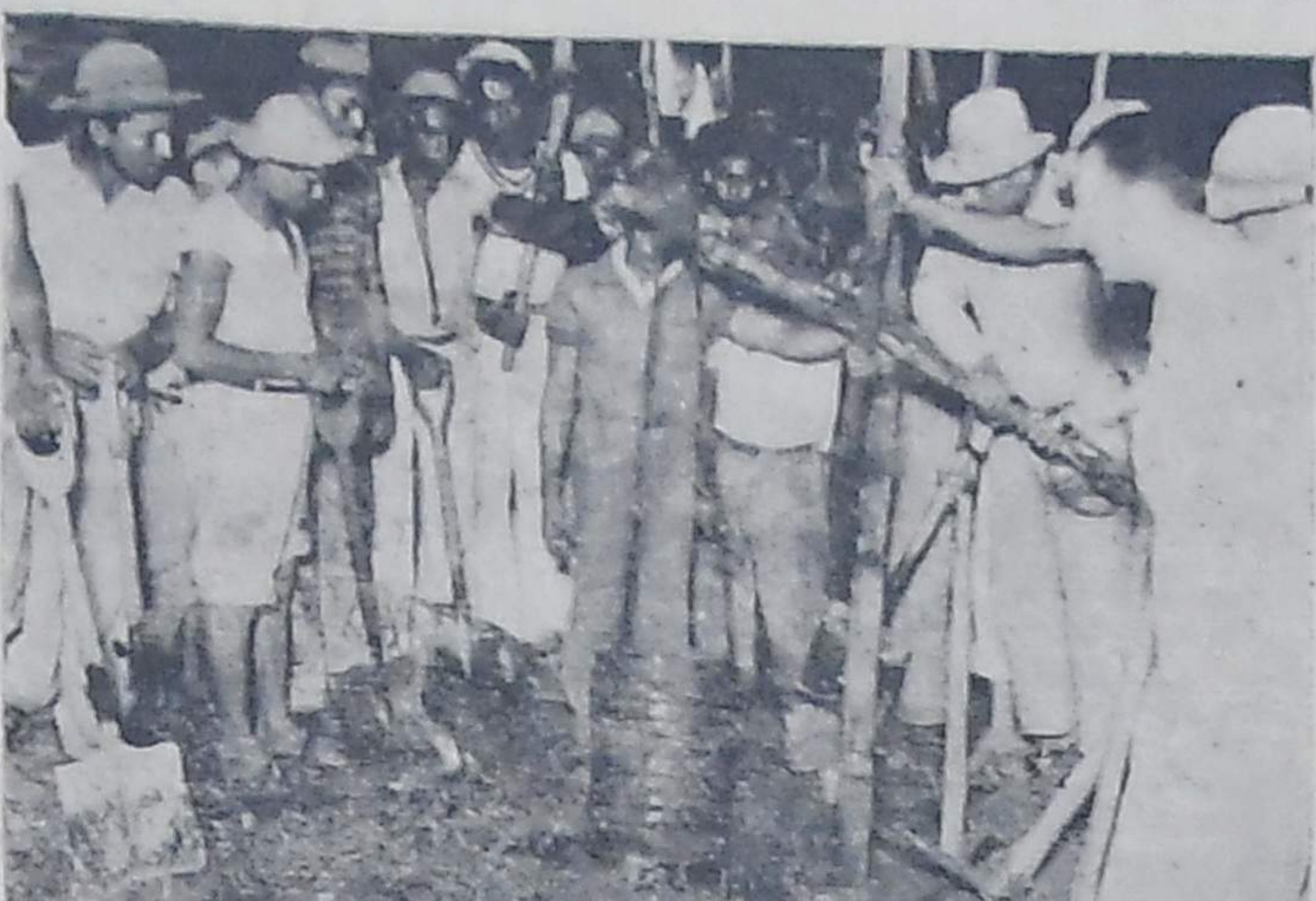
A bomba localizada e removida pelo S. de Desobstrução e Incendios, no exercicio de ontem