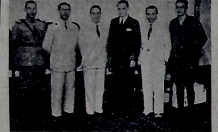
Gripo feito no Palácio da Redenção, vendo-se o diretor do D. N. S., o Chefe do Governo paraibano, o delegado federal de Saúde em Pernambuco e auxiliares da administração estadual.

após o almoço, retornou ontem ao Recife, onde prosseguirá na sua viagem de inspeção, devendo visitar Macaé, Seropé, cidade do Salvador e Espírito Santo, dali seguindo para o Rio