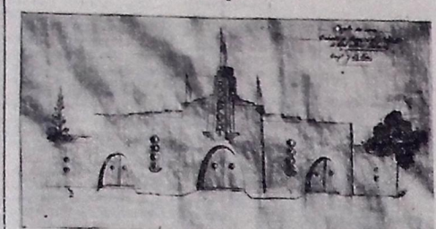
Fachada do futuro estádio do "Dolaport", a ser construído, este ano, em Cruz das Armas.