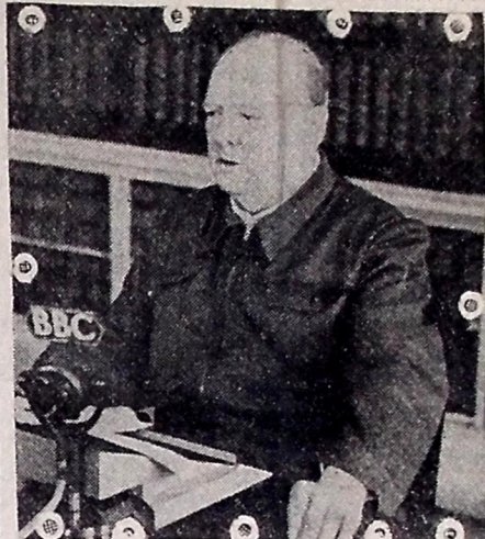
O Primeiro Ministro Britânico Winston Churchill, diante do microfone da B. B. C. durante um de seus famosos discursos que são irradiados para o mundo inteiro. Na fotografia aparece vestindo seu já conhecido "siren suit".

MORREU O EX-PREMIER AUSTRIACO ESTOCOLMO, 26 (U. P.). — O ex-primeiro ministro austriaco Schussnig morreu num